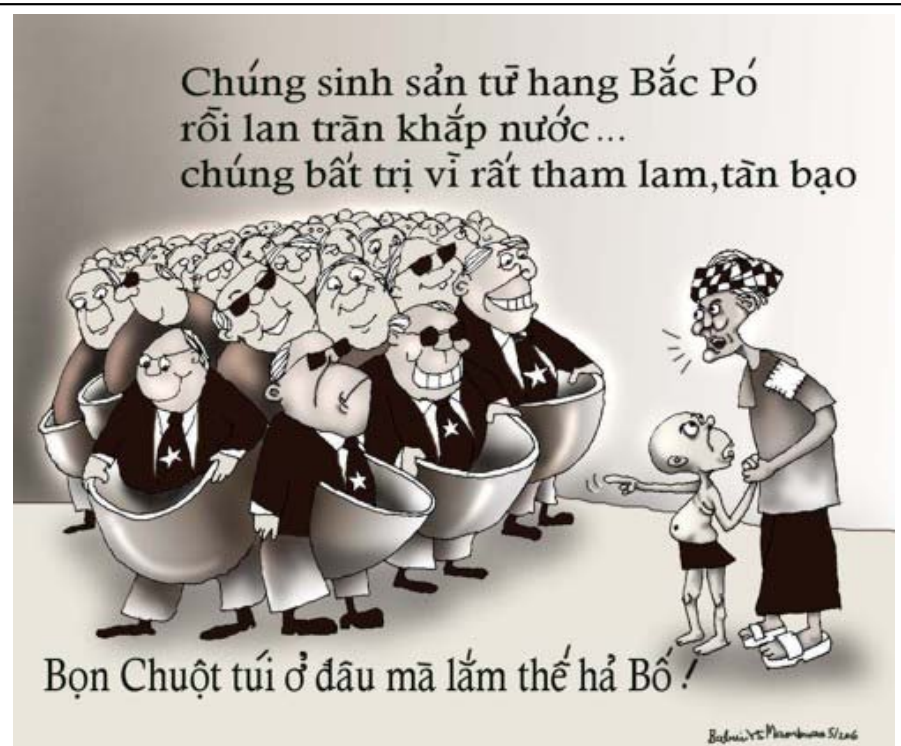
Tác giả: Babui - Nguồn: Danchimviet.online